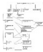
Схема 2. Методическая служба школы