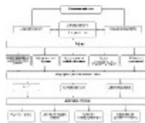
Схема 3. Система работы заместителя директора школы по воспитательной работе